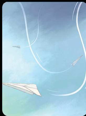
Bajar en Picada