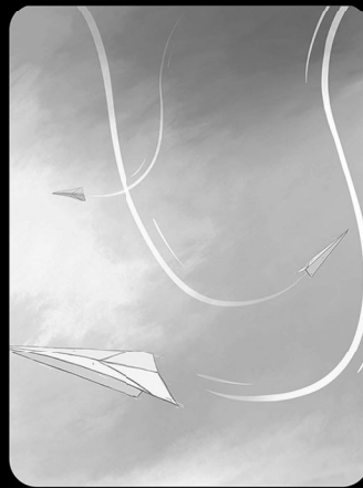
Bajar en Picada